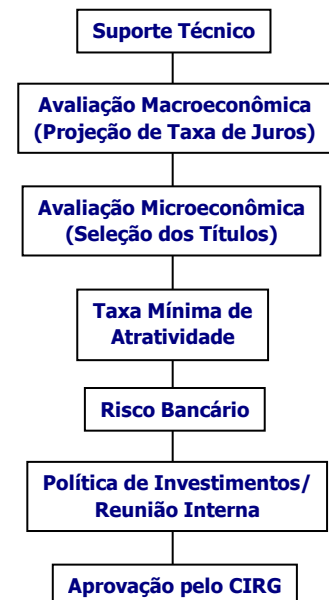
Processo de Seleção de Investimentos Renda Fixa