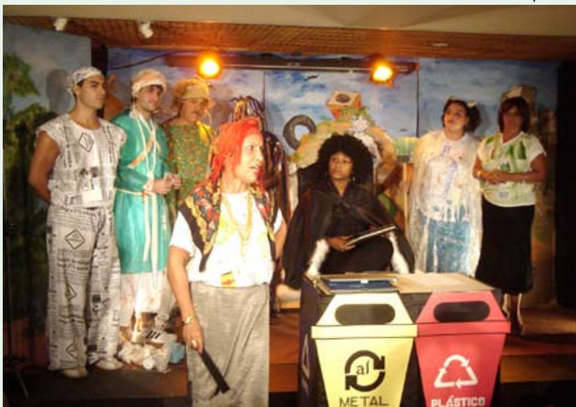
Apresentação da peça "A revolta do Lixo" com o Grupo Real em Cena