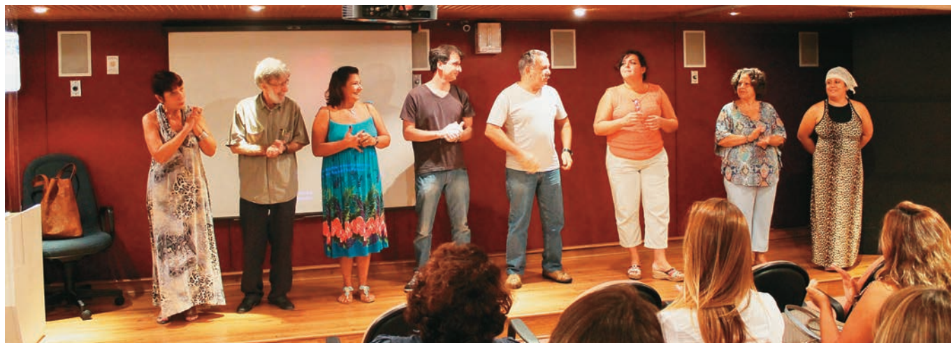
Uma das atrações preparadas pela Real Grandeza para a data foi a peça "Rádio Mulher", apresentada pelo grupo Real em Cena