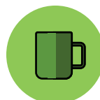
Objetos ou superfícies contaminadas