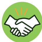
Toque ou aperto de mãos