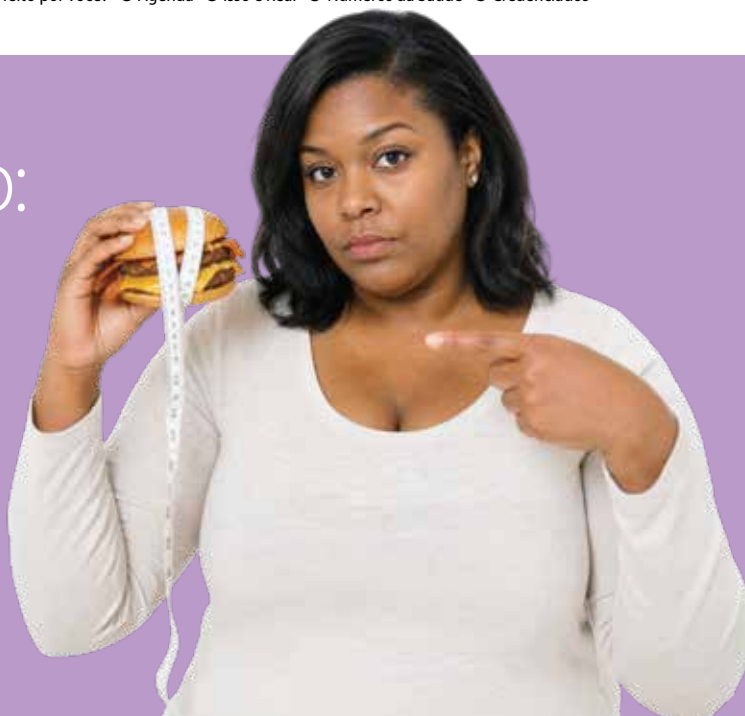
Imagem gerada por IA

O Dia Mundial de Conscientização dos Transtornos Alimentares, celebrado em 2 de junho, joga luz sobre patologias complexas e frequentemente silenciadas pela vergonha e pelo preconceito. Condições como a anorexia nervosa, a bulimia e o transtorno da compulsão alimentar não são escolhas de estilo de vida, mas sim doenças mentais graves com profundos desdobramentos físicos. A data busca desmistificar esses quadros, promovendo a empatia e a urgência no diagnóstico precoce.